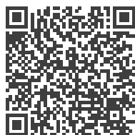
Hier finden Sie unsere How-To-Videos