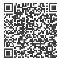
Hier finden Sie unsere Webinaraufzeichnungen

Fronius Schweiz AG Oberglatterstrasse 11 8153 Rümlang Schweiz pv-sales-swiss@fronius.com www.fronius.ch